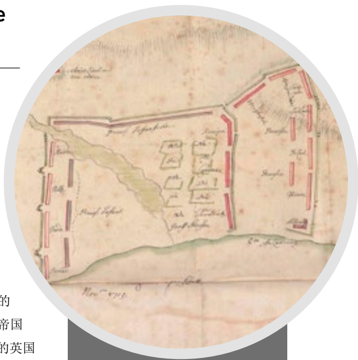
占领吕根岛的计划，Lavergne致信Tilson。德累斯顿，1715年11月30日。

该部分还收录了英国与丹麦、与土耳其和奥斯曼帝国的通信往来。与奥斯曼帝国的关系让英国外交官打破了欧洲新教-天主教二分的标准。