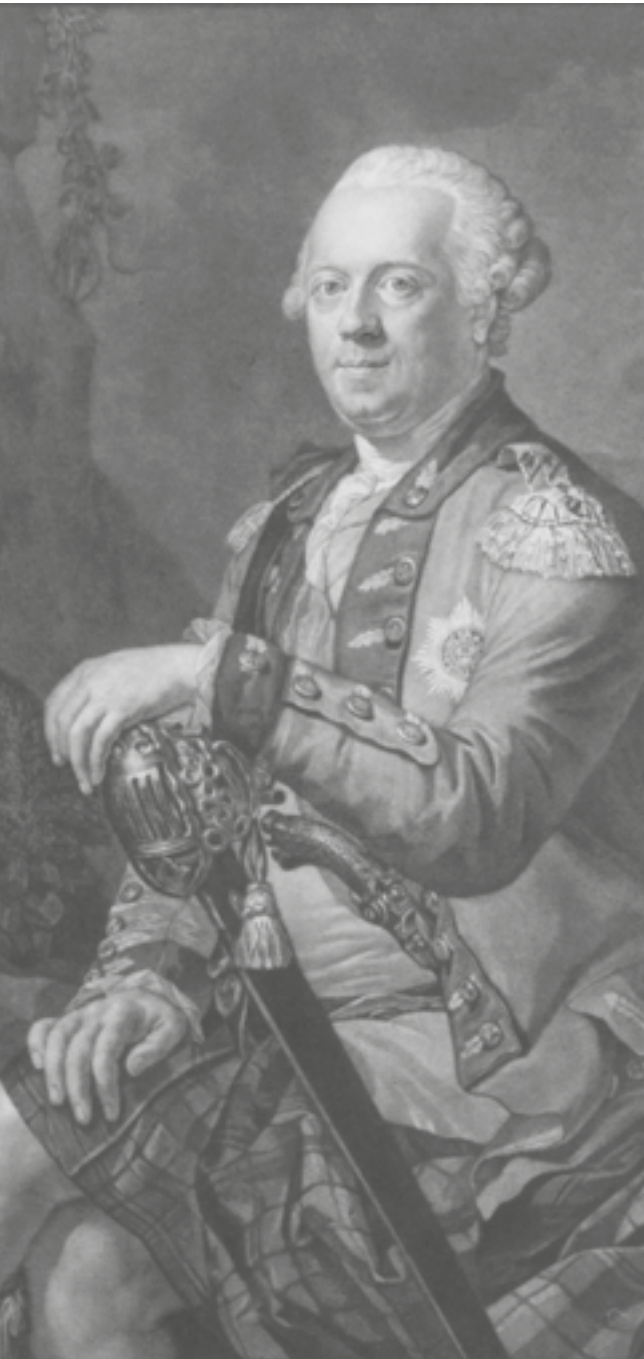
罗伯特·默里·基思爵士肖像，J. Jacobè在A. Graff, mezzotint作品基础上最终完成，1783年（NPG D 16181）