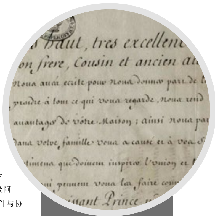
安妮女王逝世后乔治一世即位时路易十四写给他的信件，1714年9月3日，法国。

来自欧洲战争和盟国——例如反对西班牙的四国同盟（1718-1720年）和七年战争（1754年-1763年）——的报告和信件，与其他引发广泛国际反响的事件一同收录在这部分的档案中。1718年法国塞勒米尔阴谋的揭露、1768-1769年的科西嘉危机以及对詹姆斯党王位觊觎者的详细报告也都收录其中。