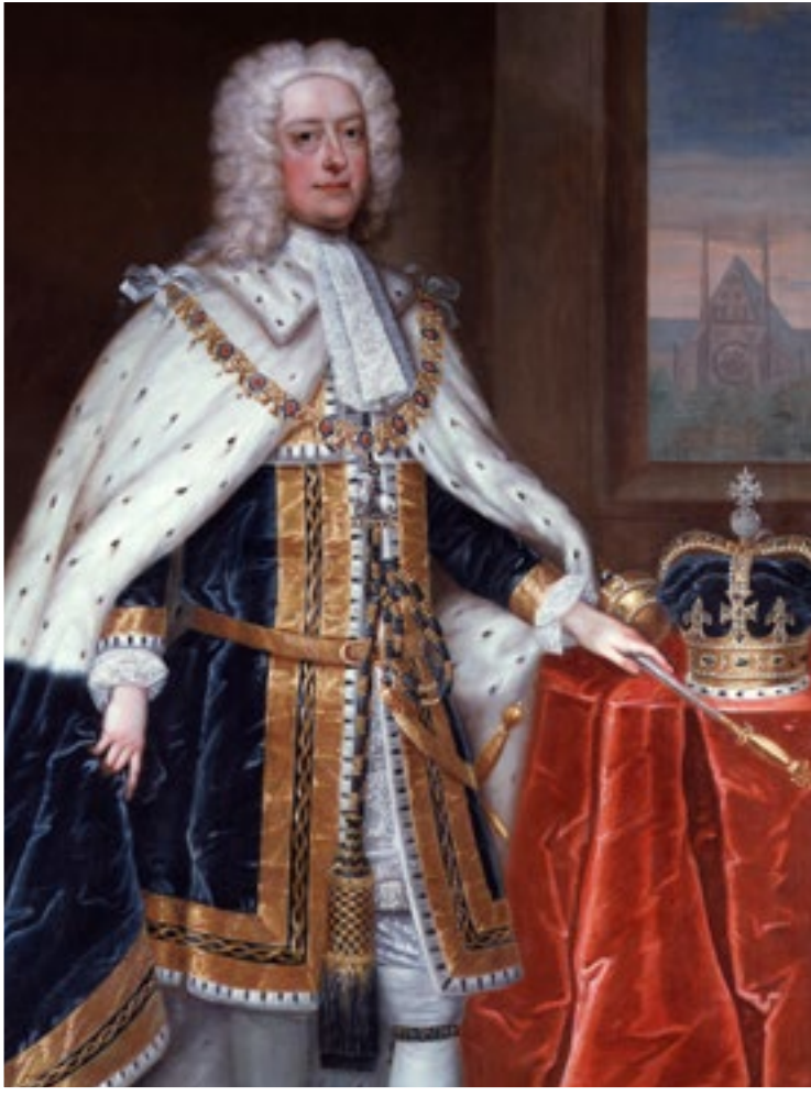
国王乔治二世，Charles Jervas画室，约1727年（NPG 368）