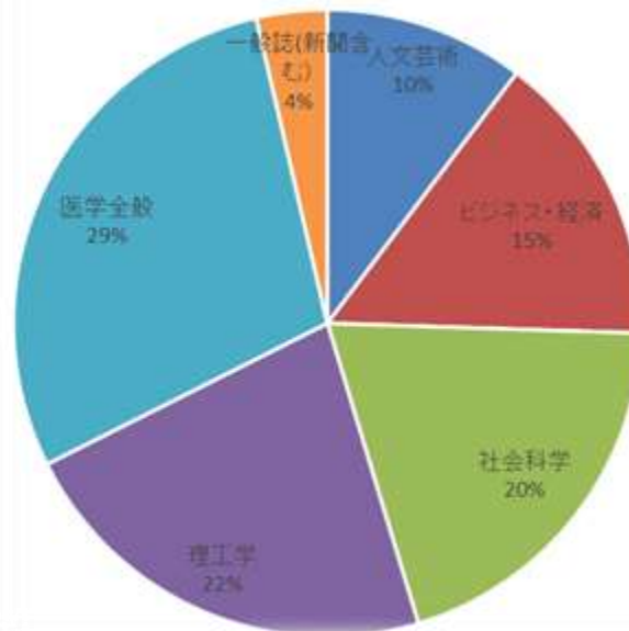
フルテキスト最新タイトル分野別